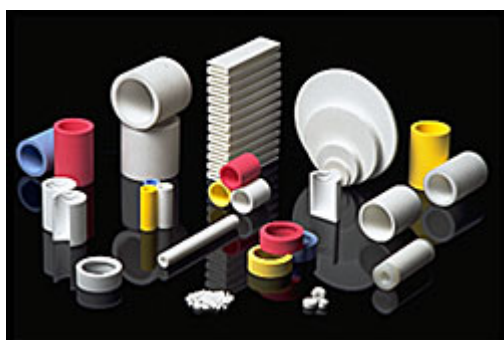
Pièces moulées selon les spécifications clients