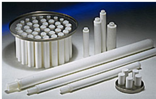
Cartouches et plaques de filtres

Nous fabriquons pour nos clients et pour permettre une utilisation dans les différents dispositifs de filtration, des moyens filtrants dans pratiquement toutes les géométries et avec des finesses de filtration les plus différentes, allant de 1 \mu\text{m} à 100 \mu\text{m} et bien au-delà.