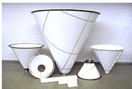
fonds et trémies de ventilation