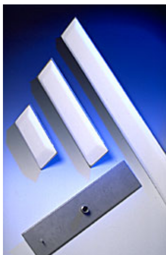
barrettes de ventilation